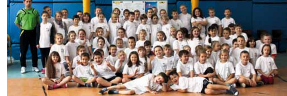
cd. na str. 3

Szkolny Związek Sportowy „Opolskie” w ramach Funduszu Inicjatyw Obywatelskich zaprosił do udziału w projekcie pn: „Opolszczyzna - kuźnia sportowych talentów” wszystkie gminy z województwa opolskiego. W ramach projektu we wszystkich zainteresowanych gminach przeprowadzono testy sprawnościowe dla młodzieży szkolnej.